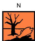
nebezpečný pro životní prostředí

Obsahuje: alkyl(C12-C16)benzyltrimethylamonium-chloridy; guanidin, N,N''-1,6-hexandiylobis[N'-kyano- polymer a 1,6-hexandiamin, hydrochlorid